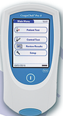
CoaguChek Pro II