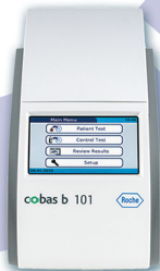
cobas b 101