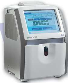
cobas b 123